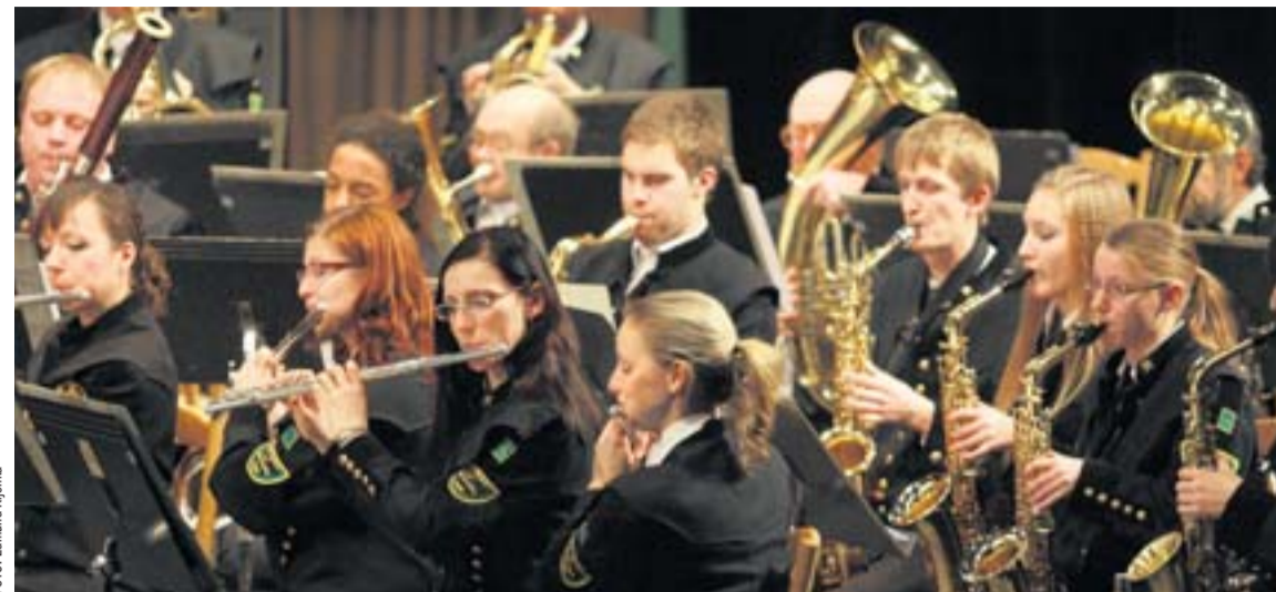
Také letos přivítala Karviná Nový rok koncertem hornického dechového orchestru Májovák.

Koncert velkého dechového souboru Májovák doprovázela sbírka pro Barborku