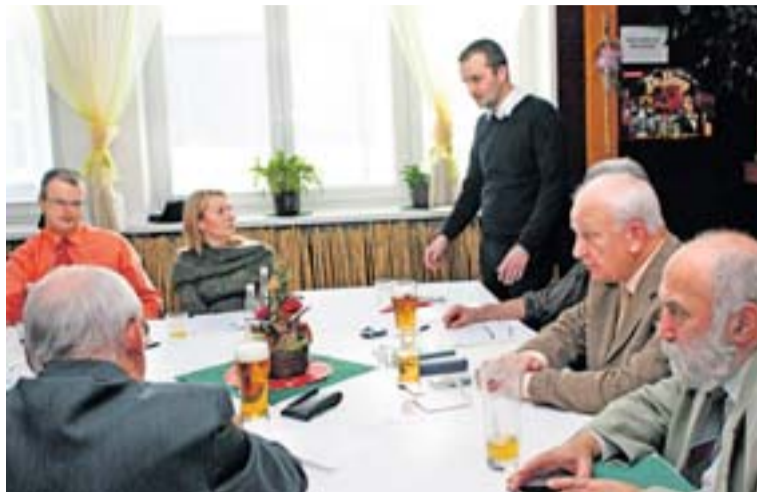
Z jednání správní a dozorčí rady Nadace Landek Ostrava.

K 25 podpořeným projektům přidala Nadace Landek loni i dva vlastní. Za účasti zástupců největších sponzorů a ostravského magis-