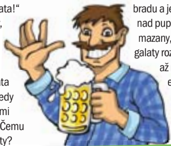
Jak to vidí stryk Lojzek

vidi, se dycki pta, kolik stařik měřil a esli ty gatě su skutečně jeho... Dycki se při tym spomenu na kamoša, co se mnu kdysi faral na ostravském Bezručiu. Temu segra emigrovala do Států, a když se z její navštěvy vratil jeho tata, chlubil se fotku, na kere se fotr natahuje na zahradě po rajčatach na keřiku. A dycki říkal: „Tak velke ma segra rajčata!“ To trvalo až do doby, než se ho kdosik zeptal: „A něsu nahodu ty rajčata normalni, ale tvuj tata je taky maly?!“ A vtedy chlubení s americkými rajčatami skočilo. Čemu všecy ty dluhe dřisty? Temu, že v nedělu po Novym