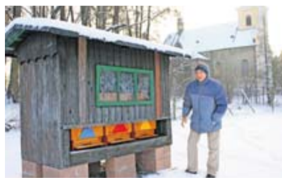
Bludovické školní úly, u nichž se děti učí včelařským dovednostem.