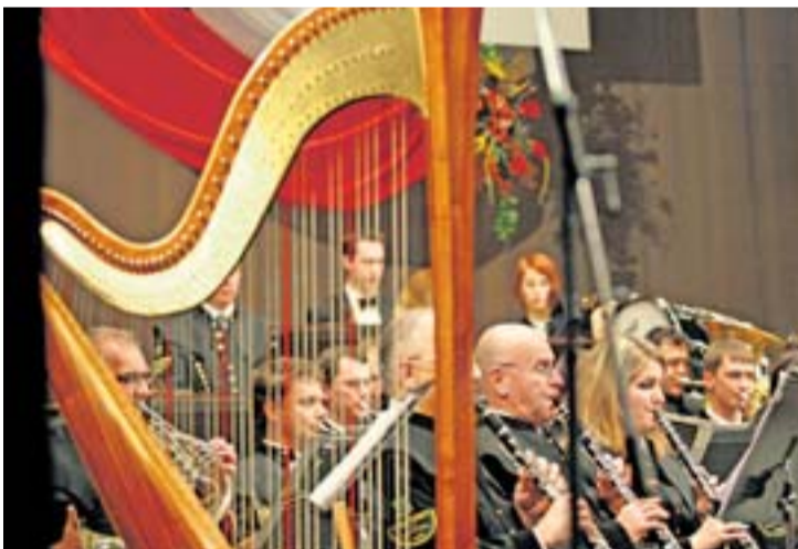
Górnicza orkiestra dęta „Májovák” podczas koncertu noworocznego w Karwinie.

Karwina przywitała Nowy Rok koncertem górniczej orkiestry dętej