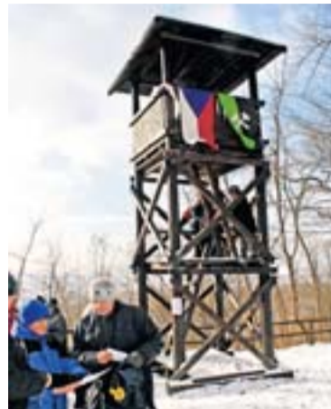
Výhled z landecké rozhledny, vyzdobené mj. hornickou vlajkou, potěšil velké i malé.

OSTRAVA – Jiskřivý sníh, pár stupňů pod nulou a romantická zimní krajina. Přesně takové kulisy provázely letošní Novoroční výstup na Landek, který už po jedenácté uspořádal Klub českých turistů, odbor Baník Ostrava OKD. Není divu, že akce opět trhala rekor-