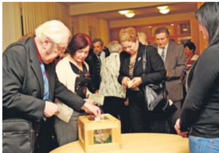
Sepětí města a jeho občanů s hornictvím podtrhla sbírka pro Občanské sdružení svatá Barbora.

Vyhodnocení sbírky se konalo ve středu 5. ledna odpoledne na karvinském magistrátu, po uzávěře tohoto vydání Horníka. bk