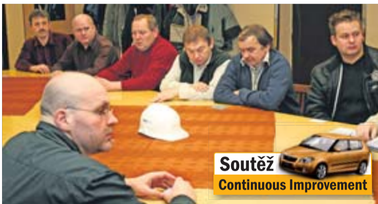
Losování mimořádných odměn v soutěži CI se zúčastnili i autoři úspěšných nápadů.