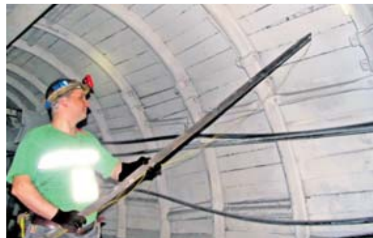
Lazeční střelci se loni činili i na protiotřesové prevenci.

ku důlních horských otřesů, které mají mnohdy devastující účinky a mohou ohrozit životy a zdraví pracovníků v postižené oblasti.