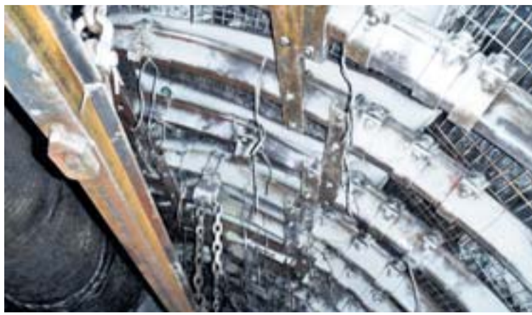
Detail použití vaků naplněných cementovou směsí, které brání postupnému uvolňování horniny na výztuž a její konvergenci.

Dalším neméně důležitým prvkem pro zachování stability důlních děl na Dole Karviná je používání svorníků, tzv. vysokého kotvení TH výztuže. Spočívá k ukotvení výztuže do vyšší-