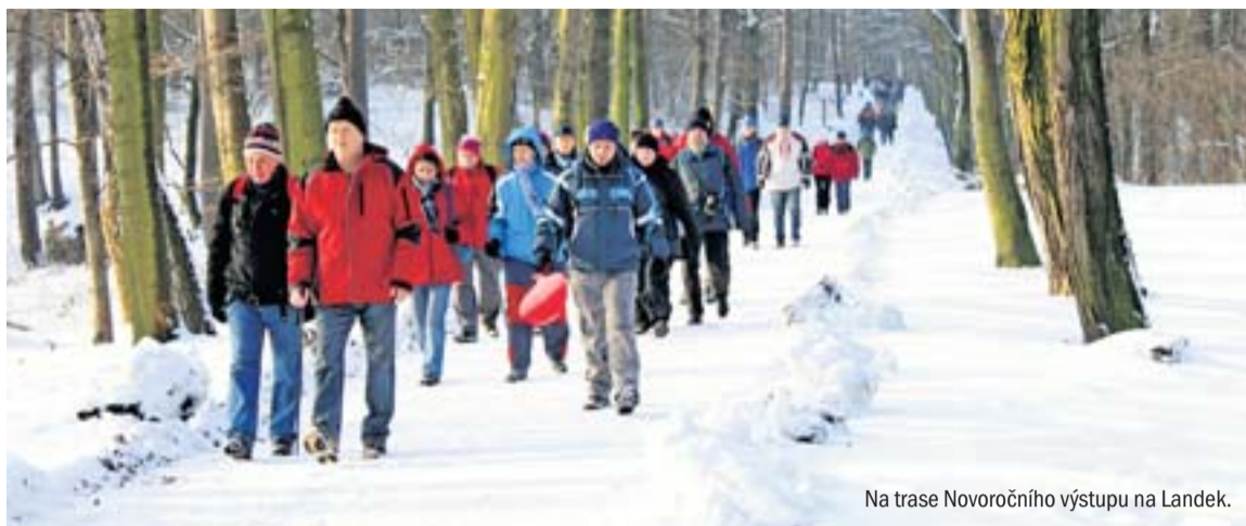
Na trase Novoročního výstupu na Landek.

dy návštěvnosti. Pro pamětní list z výstupu si přišlo 304 účastníků, další desítky, možná stovky lidí si vychutnali pohled z landecké rozhledny, ale do fronty pro diplom se jim nechtělo.