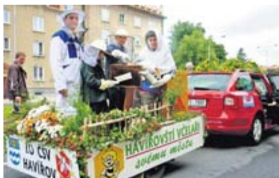
Ambrožiči v alegorickém voze na letošních slavnostech Havířov v květech.