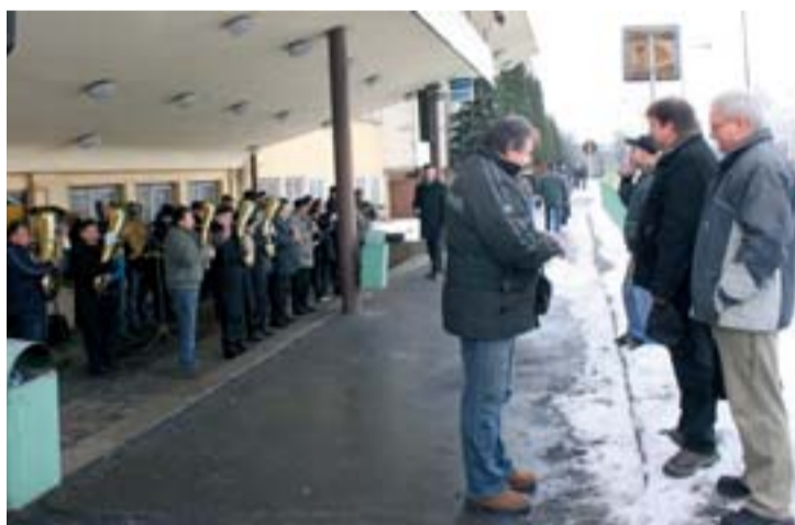
Před prvními směnami po Novém roce zahrála darkovským horníkům Hornická dechovka Dolu Darkov.