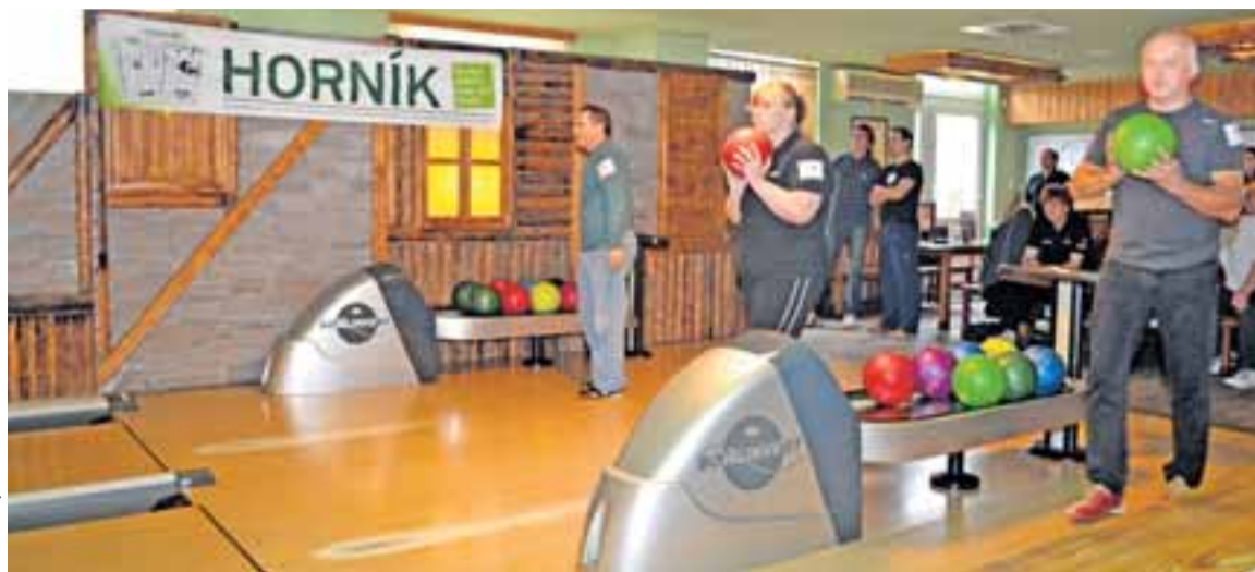
Po třech předchozích kolech se finálové boje HBC 2011 odehrají na profesionálních „bezšňůrkových“ drahách Bowling SKY v Ostravě-Porubě.

Do finále tří soutěží – Zlaté skupiny, Stříbrné skupiny a turnaje určeného celkům složených výhradně ze zaměstnanců OKD – se však probjaly jen ti nejlepší, dohromady 12 týmů. O tom, které z nich a v jakém složení to jsou, jsme psali v minulém vydání Horníka. Dnes přinášíme časový harmonogram závěrečných duelů. A v nich půjde o mnohé (Horník č. 37, str. 7). Připomeňme, že jde o ceny v celkové hodnotě přesahující 400 tisíc korun.