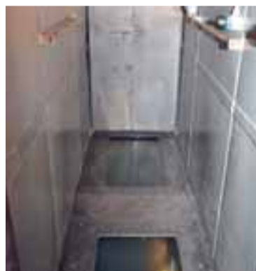
Podlaha těžní klece s monitory zprostředkovávajícími dojem autentického farání do podzemí.