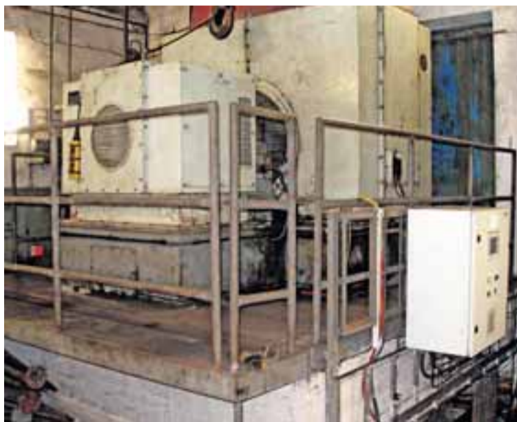
Po montážních pracích a zkompletování ventilátoru do původního stavu byl stroj zkušebně najet v bezzátěžovém režimu a následující den spuštěn „naostro“.

Po změření souososti stroje, funkčnosti a neporušenosti lopatek oběžného kola následovala časově náročnější operace, a to odkrytí střechy ventilátoru, demontáž a vytažení oběžného kola. Následně došlo k plánované demontáži inkriminovaného ložiska. Již samotná