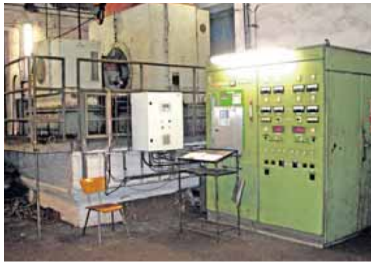
Hlavní důlní ventilátory patří k nejdůležitějším strojním zařízením na šachtě.

Radomil Ocisk vedoucí povrchových provozů