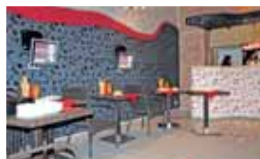
Příspěvek Nadace OKD také pomohl zútlunít interiér kavárny Pierot Café.

Kavárna Pierot Café, která byla otevřena v září roku 2009, je unikátní tým, že zde mají slyšící návštěvníci možnost učit