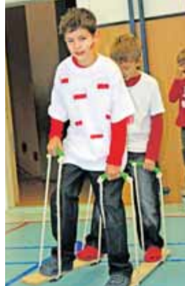
Dzieci z Hawierzowa i Jastrzębia podczas wspólnej zabawy. Kto pozna Małysza?

Nazwisko polskiej legendy sportowej dzieci zapamiętały dzięki jeździe na nietradycyjnych nartach, słynnego kompozytora muzycznego przypomnieli sobie podczas zabaw