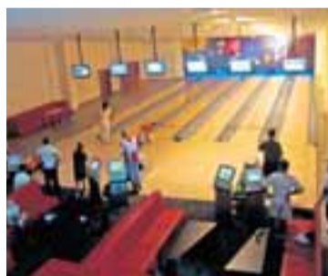
Herna MOSiRu v polském Łaziska Górne.

dokonce založil a vede ve své ulici v Łaziscích uliční oddíl odbíjené, aby odlákal mládež od stánků s pivem a přivedl ji na sportoviště. Soupeře pro něj shání doma, ale také na české straně hranic. S kuželkami - těmi klasickými - začínal někdy před 30 lety v kuželně u své mateřské šachty a stal se i registrovaným hráčem. Bowling začal hrát před pár roky, kdy se tento sport objevil i v našich zeměpisných