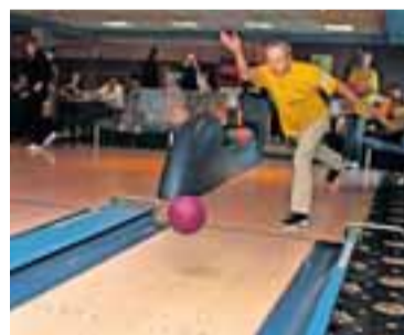
Kapitán polského týmu v akci U Alberta.