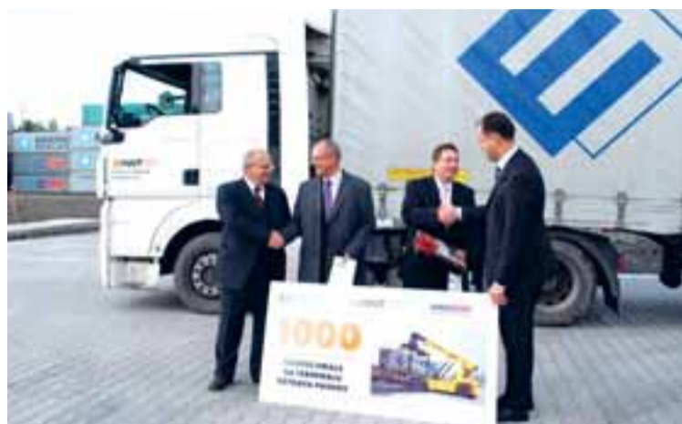
Slavnostní okamžik - na terminálu AWT v Paskově 13. října přeložili tisíce mega návěs společnosti EWALS Cargo Care CZ.

Společnost EWALS Cargo Care CZ se jako první silniční dopravce chopila nabídnuté příležitosti a začala pravidelně využívat každodenního servisu kombinovaných