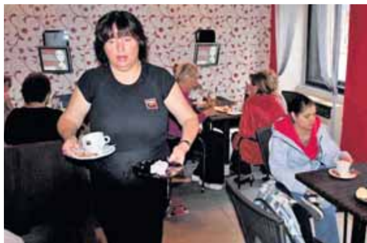
Kavárna zaměstnává sedm neslyšících – provozní, čtyři servírky a dvě pomocné síly.

se komunikovat ve znakové řeči. Kavárna je vybavena dotykovými displeji, kde je překladový slovník z českého jazyka do českého znakového jazyka. Slyšící host si zde může požadovaný znak přehrát a následně si u neslyšící obsluhy objednat ve znakovém jazyce.