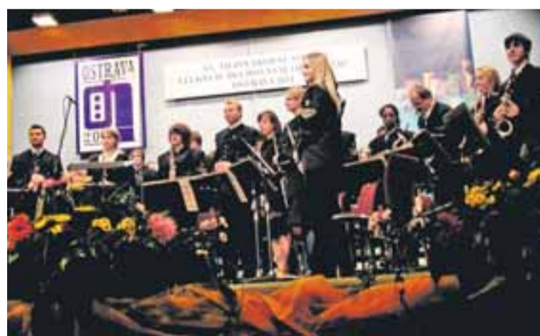
Májovák na scéně 15. ročníku ostravské Mezinárodní soutěže velkých dechových orchestrů.

Kompletní program natáčela Česká televize, záznam soutěže a karvinské vítězství odvysílá v pořadu „... a tuhle znáte?“ v sobotu 26. 11. 2011 od 10.00 hodin na programu ČT2. Petr Žeňč