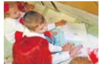
Děti skládaly noty po vzoru polského skladatele Chopina.

Poláci učili české kamarády, jak lyžuje Malysz a co doma vaří