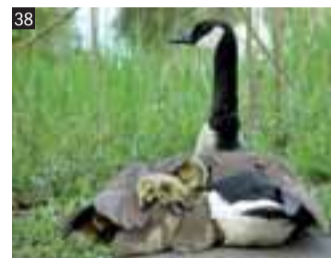
Výherci soutěžní fotografie č. 38 jsou: Ludmila Kasperská z Ostravy, Ludmila Kokšová z Frýdlantu nad Ostravicí a Martin Rezníček z Frýdku-Místku.

V přírodě lze najít řadu nevšedních situací, které nás mohou inspirovat k zajímavým postřehům a vtipným komentářům. Dokumentuje to např. náš soutěžní snímek č. 38, na kterém housátka našla teplo a bezpečí pod křídlem své matky. Co si o této situaci pomysleli naši čtenáři a jakými texty na ni reagovali? Přečtěte si tři nejvydařenější texty, které doputovaly do naší redakce. Jejich autory oceňujeme stokorunou.