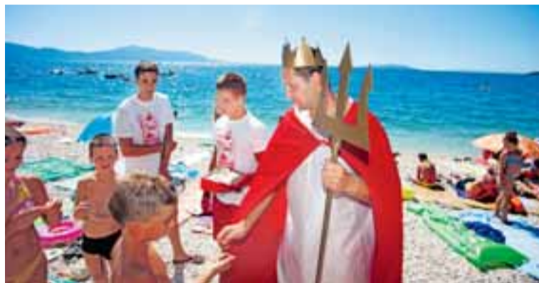
Neptun Klub nabízí na chorvatském pobřeží malým i velkým animační programy od rána do večera.

pobytových míst připravujeme animační program doslova od rána až do večera. Věříme, že jeho obsah v příštím roce opět zpestří vystoupení známých osobností ze života českého showbizny.