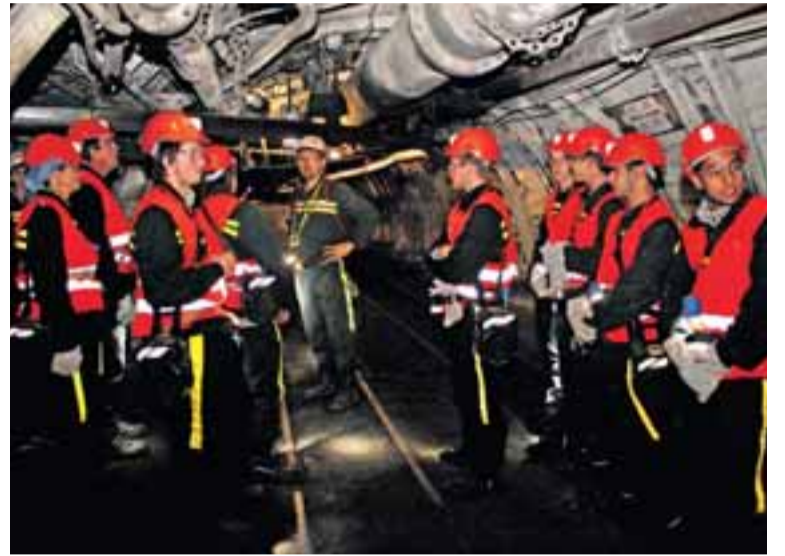
Młodzi adepci górniczego zawodu podczas swej pierwszej wizyty na dole kopalni.

W Kopalni „Karwina” siódemka przyszłych ślusarzy obejrzała przodek przekopu przewozowego 01196, realizowanego na poziomie 11. piętra na głębokości 930 metrów. Przekop połączy w przyszłości zakład „ČSA” z zakładem 2 Kopalni „Darków”. Wyrobisko o profilu 4DVRK (6700 x 4550 mm) jest realizowane w kamieniu metodą klasyczną, przy pomocy robót strzałowych. Przodek jest uzbrojony w najnowocześniejszą maszynę wiertniczą Deilmann-Haniel z dwoma lawetami DH-DT2, 600-milimetrowy przenośnik zgrzeblowy z kruszarką, platformę roboczą do zabudowy stropu i inny