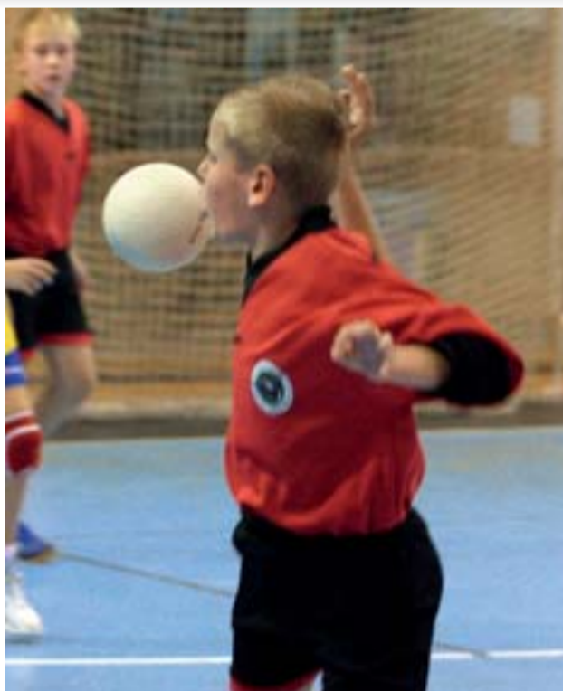
Mládežníci HCB OKD ovládají házenkářský míč dokonale. Dělalí s ním dokonce žvýkačkové bublinky.

Ctižádostivý šachový velmistr cestuje vlakem a z dlouhé chvíle vyzve k partičce staršího muže ze sousedního kupé. A ten partii neprohráje. Velmistr praví: „Uhrál jste remízu, gratuluji. Ale poslyš-