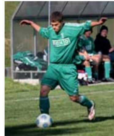
„Takhle musíš letět do brány, takhle!“