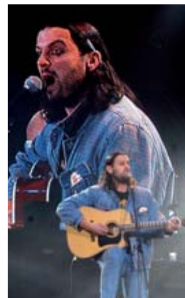
Na pódiu zpívá, hraje, improvizuje.

„Když říkám, že Ruda fáral na šachtě, je to stoprocentní pravda,“ pokračoval s tím, že ho pod zem bral nejen táta na „rodinné“ exkurze. V dětství komik totiž musel – tak jako další školáci v socialistickém Československu – být členem pionýra a v budovatel-