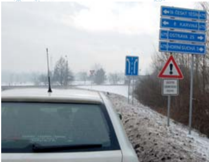
Ukazatele směru při odbočování ze Stonavy...

Když vyjedete ze Stonavy na Ostravu, po dvou kilometrech zjistíte, že se vám krajské město nepřibližuje, nýbrž vzdaluje!