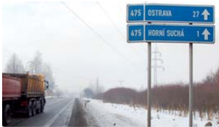
...a o 2,1 kilometru dále směrem na Ostravu v Horní Suché.

Zda se jedná o aktuální silvestrovskou legraci cestářů, se můžeme přesvědčit v prvních dnech následujícího roku. uzi