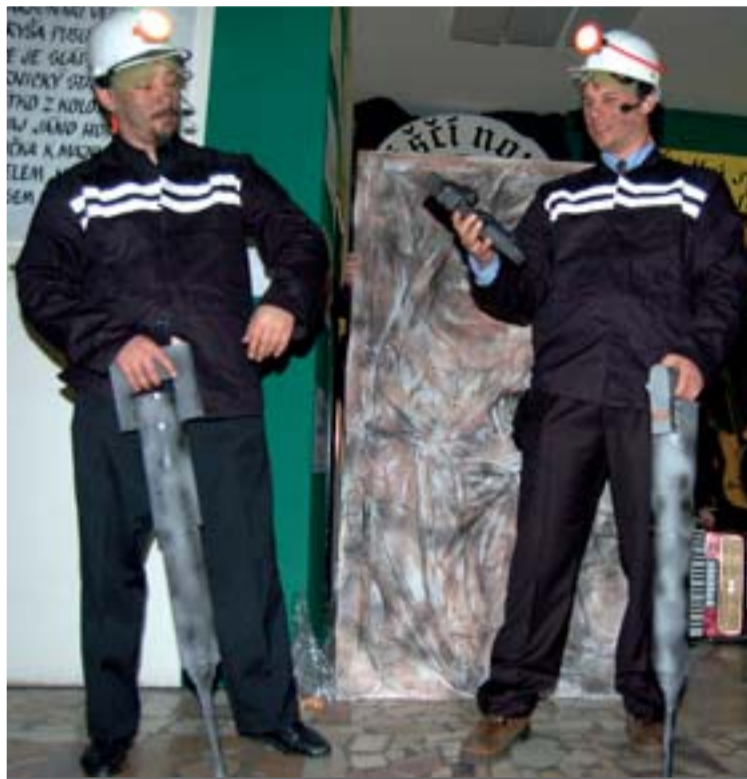
Hlavní je, nezakecat se, jako tito dva ve scéně paskovských havířů na letošním šachtáku.

Letím na úsek. Na chodbě vedle hajzlu hodím oko na nástěnku, jak