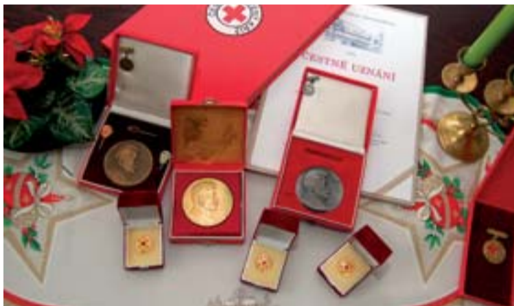
Část medailí, plaket a uznání od Červeného kříže.