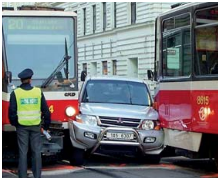
(pro přesnost - situace na snímku je z jedné pražské ulice kousek od Újezda...)

Miláčku, jsi to ty? Jak, kdo volá? Já! Přece tvoje prdelka. Miláčku, stal se problém.... Ne, nejsem v tom. Miláčku, s tím tvým novým stříbrným Mičubiči bude něco v nepořádku. Neee, céděčko už nepřeskakuje. Tos opravil moc pěkně. Víš, trochu se odřelo. Ne céděčko. Autíčko. Ne, rám i elektrony jsou v pořádku. Ale Mičubiči je jako ohnutej. Jen trošku. Ze strany. Jak, z který strany? Z obou stran přece. Promáčknutý? A ty se ani nezeptáš, jestli se mi něco nestalo? Ty už mě nemiluješ? Ne, nic se mi nestalo. Jsi tak pozorný, že se ptáš. Miluju tě. Já vůbec nevím, jak se to stalo. To oni. Oni se na mě domluvili a schválně na mě začali najíždět. Viděli ženskou za volantem, a... Prasáci. No jako řidiči. Jako řidiči od tramvají. Jsou tak bezohlední. No, já jí chtěla předjet a v tom se v protisměru objevila druhá... Oni jezdí jak prasata. Jako u Karláku víš. Kousek před tím butikem. Já myslela, že někam uhne. Jasně, že vím, že tramvaj jezdí po kolejích. Neřkej mi krávo. Včera večer jsi mi říkal úplně jinak, když jsem ti ho.... Jak to, že tramvaj neuhne? Vždyť jsi mi říkal, že